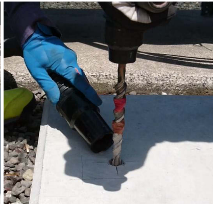
粉塵カップあり 作業イメージ