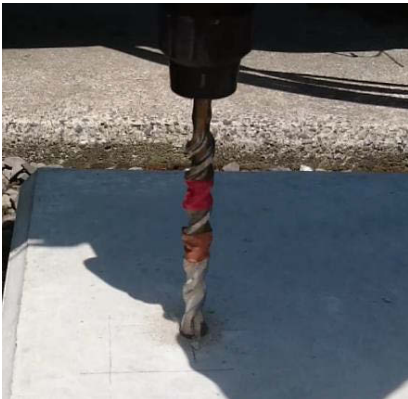
粉塵カップなし 作業イメージ