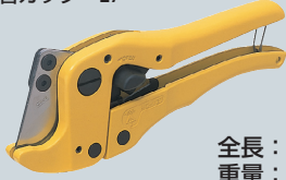
エンビ管カッター27